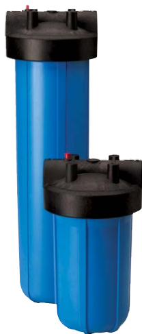
No se muestra Big Black

PARA APLICACIONES DE GRAN CAPACIDAD Y ALTO FLUJO