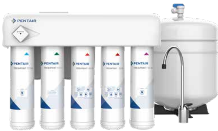
GRO-575M, [Comprend le contrôleur de MDT]